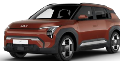
Terra Cotta (TCT) metalizowany bez dopłaty