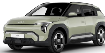
Aventurine Green (AG3) metalizowany