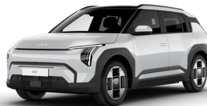
Snow White (SWP) metalizowany