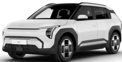
Clear White (UD) pastelowy