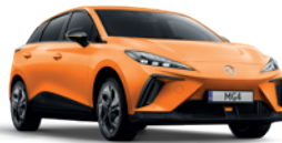
Pomarańczowy „Fizzy Orange” (trójwarstwowy)