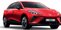
Czerwony „Diamond Red” (trójwarstwowy)