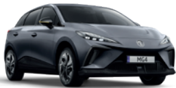
Szary „Andes Grey” (metalik)