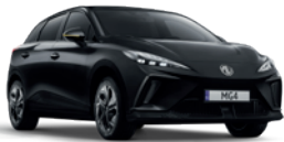
Czarny „Pebble Black” (metalik)

Wybierz wariant wyposażenia: Standard, Comfort, Luxury, Luxury Long-Range, XPOWER, i przyciągaj spojrzenia, gdziekolwiek pojedziesz.