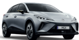
Srebrny „Medal Silver” (metalik)