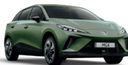
Zielony „Hunter Green” (metalik)

* Lakiery trójwarstwowe, metaliczny i perłowy dostępne za dodatkową opłatą.