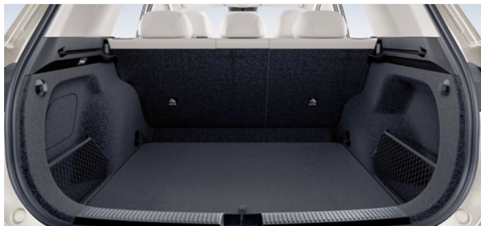
Pojemność bagażnika od podłogi do dachu 674 litry