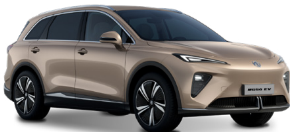
Stratford Gold (DWG) Lakier trójwarstwowy