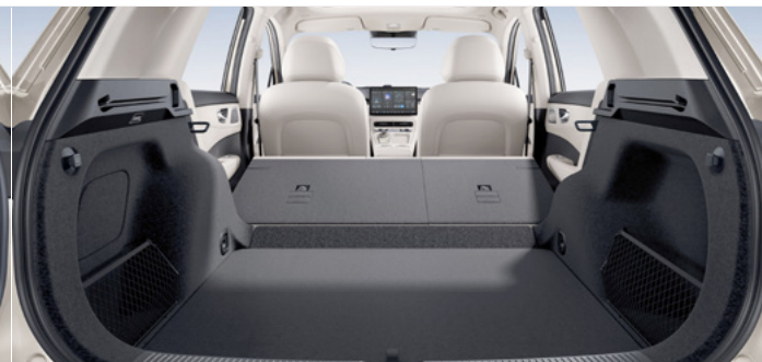
Pojemność bagażnika od podłogi do dachu (złożone fotele w drugim rzędzie) 1 910 litrów