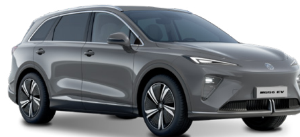
Andes Grey (PAG) Lakier metaliczny