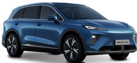
Soul Blue (JSH) Lakier metaliczny