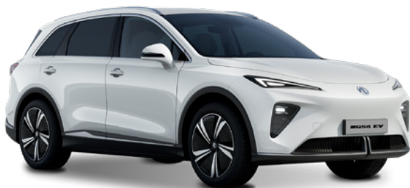
Dover White (WSB) Lakier standardowy