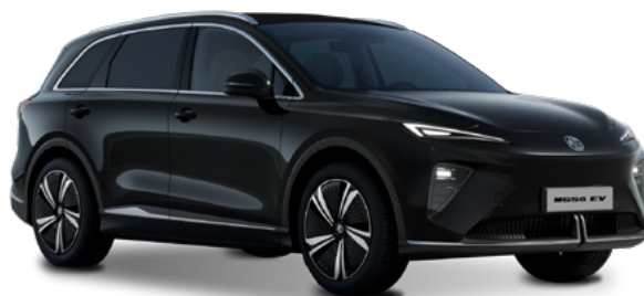
Pebble Black (PBC) Lakier metaliczny