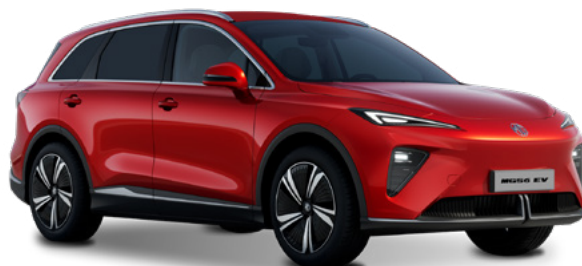
Diamond Red (RSJ) Lakier trójwarstwowy