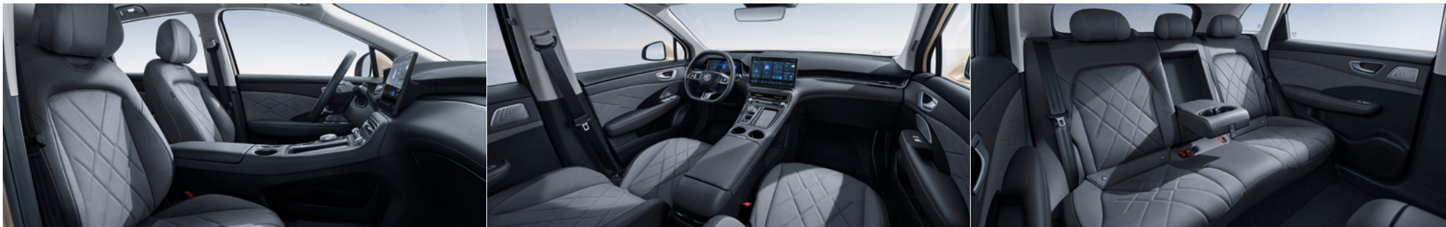
Szare fotele w stylu skóry i zamшу z dekorami imitującymi włókno węglowe