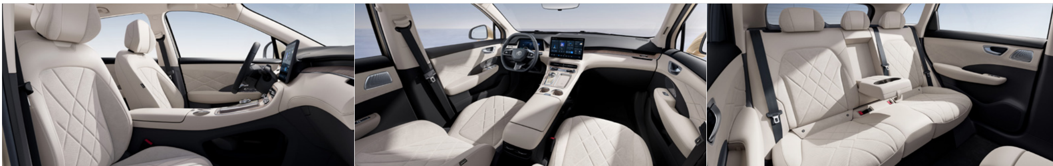
Beżowe fotele w stylu skóry i zamшу z dekorami imitującymi naturalne wykończenie