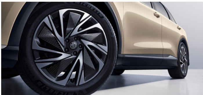
20" felgi aluminiowe Gulfstream z nakładkami Aero