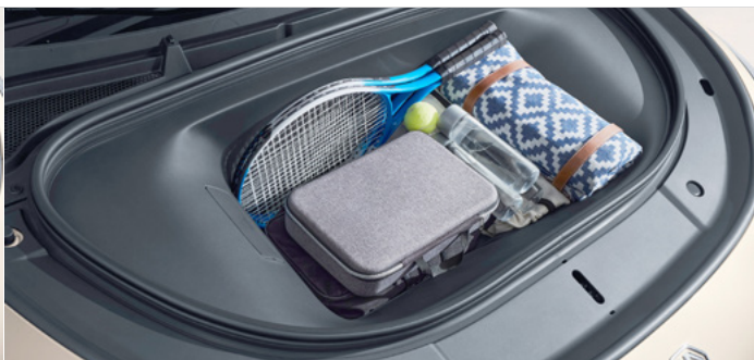
Pojemność przedniego bagażnika dla wersji Exclusive AWD 77kWh 102 litry