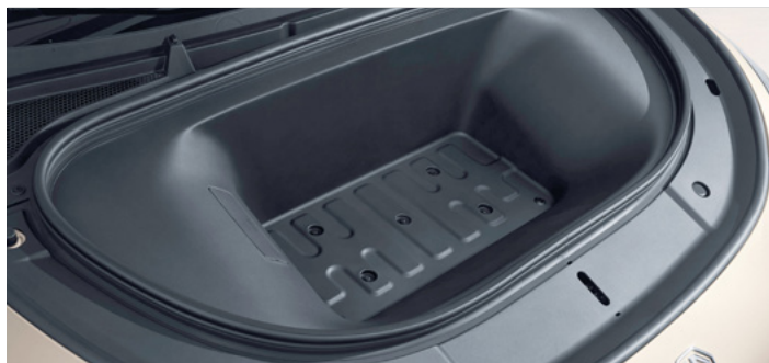
Pojemność przedniego bagażnika dla wersji Exclusive 77kWh 124 litry